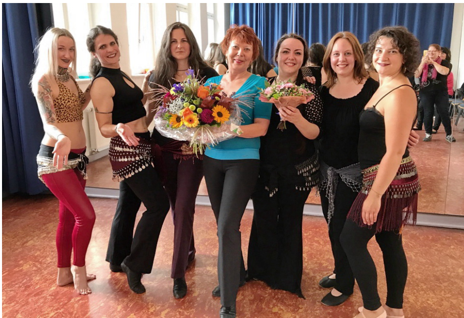
Foto: Werkschau 20-jähriges Jubiläum – Saida mit Frauen der Tanzgruppe Fortgeschrittene

Individuelle tänzerische Förderung durch Kleingruppenunterricht! Erlernbar für jede Frau und geeignet für alle Altersgruppen ab 13 Jahren! Ideal auch für Frauen von 50 bis 99 Jahren!